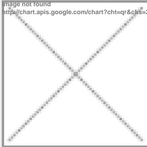
image not found http://chart.apis.google.com/chart?cht=qr&chs=250x250&chld=H|0&chl=https%3A%2F%2Fwww.immobili

https://www.immobiliaresassella.com/property/trilocale-con-doppi-servizi-2-balcone-e-box/