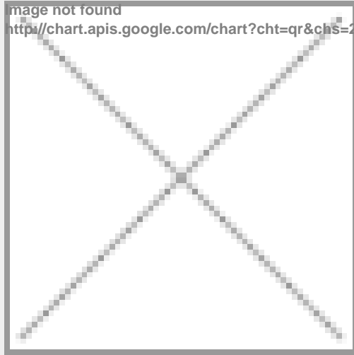
image not found http://chart.apis.google.com/chart?cht=qr&chs=250x250&chl=H|0&chl=https%3A%2F%2Fwww.immobili

https://www.immobiliariesassella.com/property/monolocale-nuovo-in-centro-bormio/