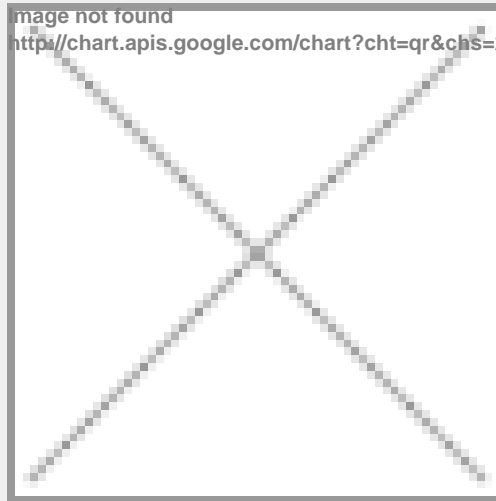
image not found http://chart.apis.google.com/chart?cht=qr&chs=250x250&chld=H|0&chl=https%3A%2F%2Fwww.immobili

https://www.immobiliariesassella.com/property/bilocale-grane-in-centro-bormio-con-5-posti/