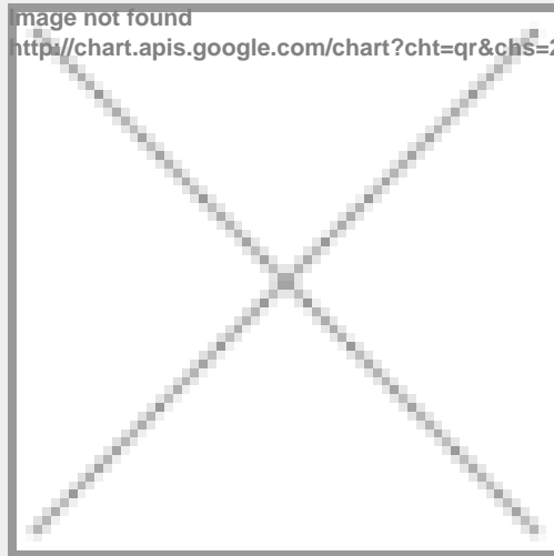
image not found http://chart.apis.google.com/chart?cht=qr&chs=250x250&chld=H|0&chl=https%3A%2F%2Fwww.immobili

https://www.immobiliariesassella.com/property/bilocale-grane-in-centro-bormio-con-5-posti/