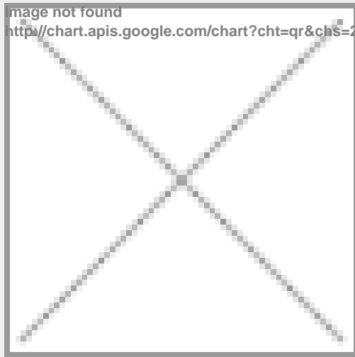
image not found http://chart.apis.google.com/chart?cht=qr&chs=250x250&chld=H|0&chl=https%3A%2F%2Fwww.immobili

https://www.immobiliariesassella.com/property/appartamento-in-affitto-in-centro-bormio/